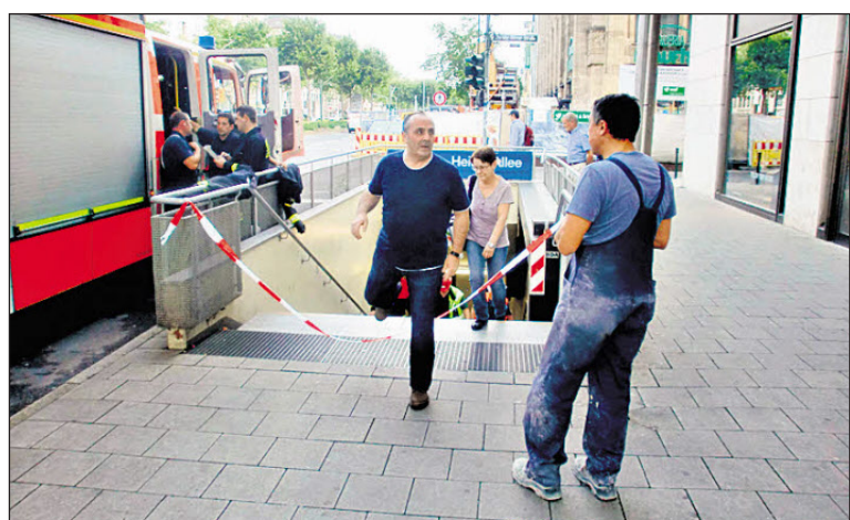
Die Feuerwehr evakuierte gestern den U-Bahnhof Heinrich-Heine-Allee wegen eines Gas-Alarms.

Düsseldorf – Gas-Alarm im U-Bahnhof Heinrich-Heine-Allee: Gegen 9.30 Uhr waberte plötzlich ein beißender Gestank über die Bahnsteige und durch die Heine-Passage. Rheinbahn-Security und die sofort alarmierte Feuerwehr evakuierten den gesamten Bahnhof.