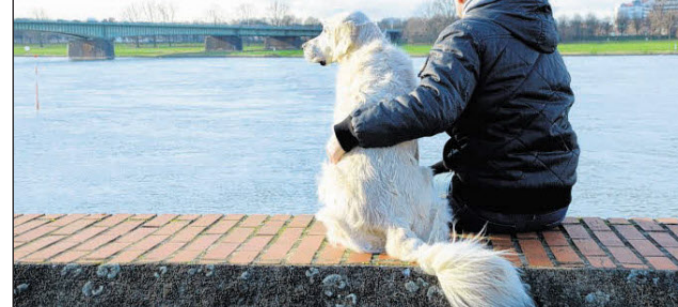
Lieblingsplatz mit Hund: Auf der Mauer in Kappes-Hamm mit Blick auf die Josef-Kardinal-Frings-Brücke.

● sechs Futter-Gutscheine. Außerdem bekommen alle Gewinner freien Eintritt zur Mes-